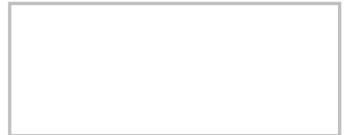
Firma del Cliente (con lapicero tinta negra, sin sobrepasar el recuadro